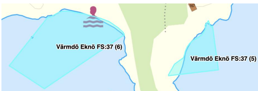
Figur 5 Eknö hemman