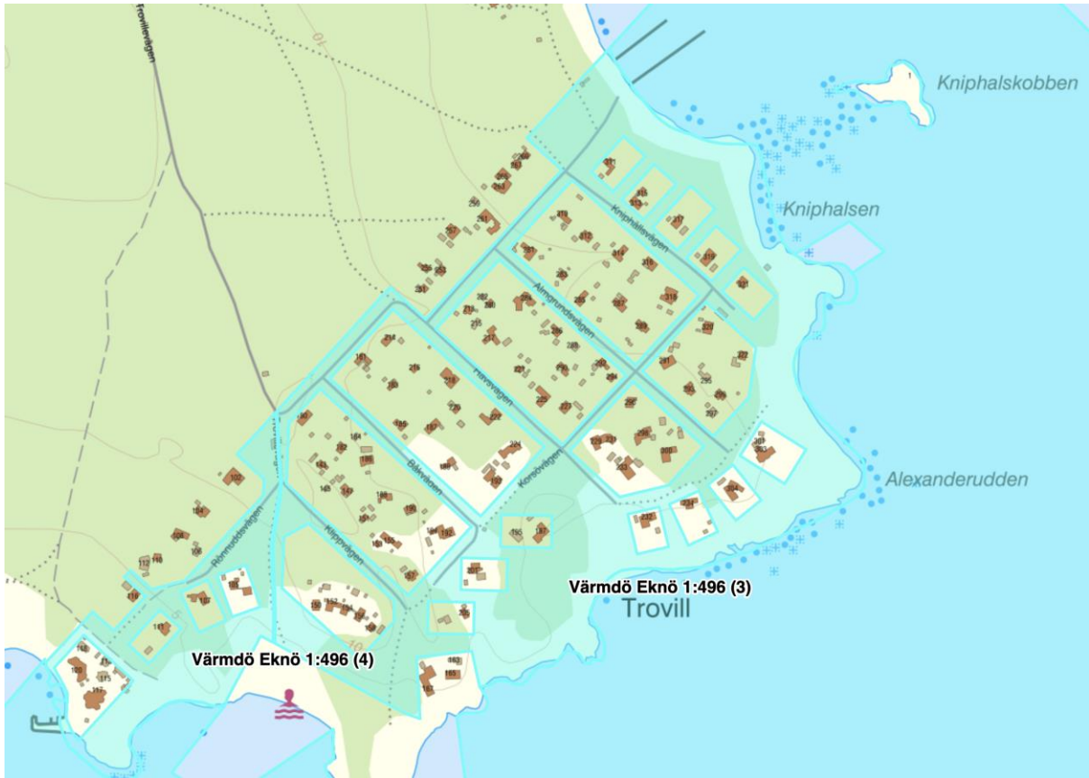
Figur 1 Allmänningar tillhörande Trouvilleföreningen