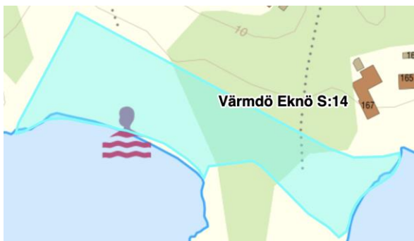
Figur 4 Eknö hemman

Föreningen äger inte stränderna stora och lilla Trouville, Brynteskobbarna och Kniphalskobben, utan dessa ägs av Eknö hemman.