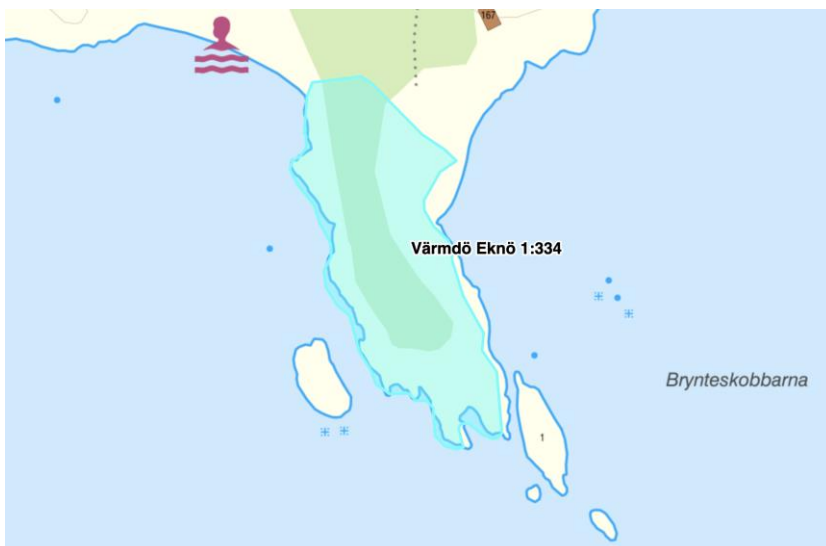
Figur 8 Calles udde

Stiftelsen Calles minnesfond äger en tredjedel av lilla Trouvillestranden samt udden mellan Trouvillestränderna.