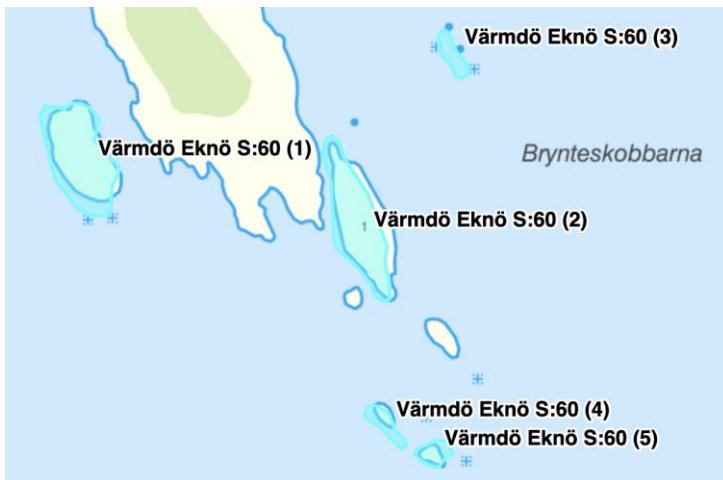
Figur 6 Eknö hemman