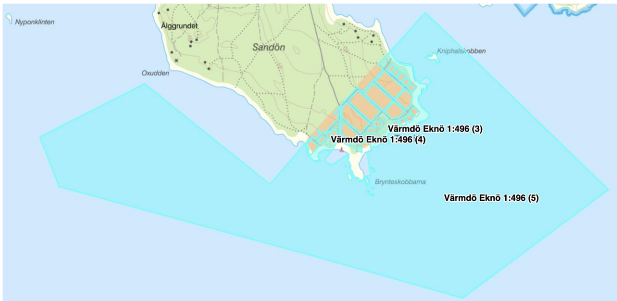
Figur 3 Fiskevatten tillhörande Trouvilleföreningen

Föreningen äger inte stränderna stora och lilla Trouville, Brynteskobbarna och Kniphalskobben, utan dessa ägs av Eknö hemman.